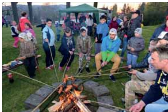
Opékání buřtů zajistili členové místního „TOMU“.