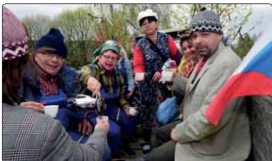
Po náročném cestě v průvodu z dolních Mikulášovic účastníkům pořádně vyhládlo.