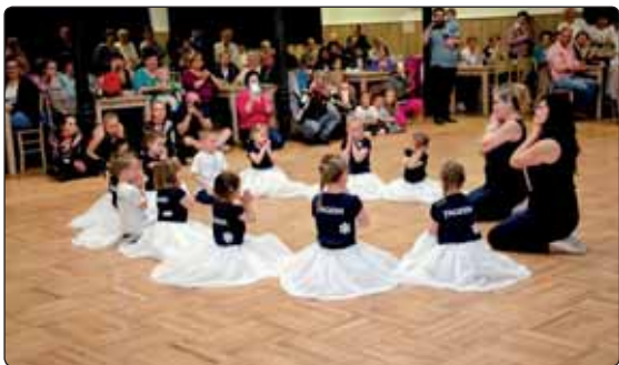
Step by Step ve spolupráci s městem připravilo pěknou akci ke dni matek.