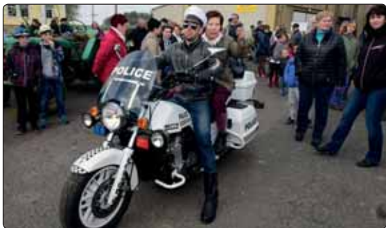
Letos se v mikulášovickém prvomájovém průvodu objevilo opět několik zajímavých strojů.