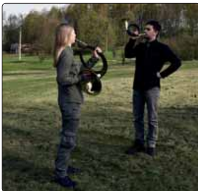
Uvítání odborníků proběhlo na louce před Slovanským domem a zahájili ho tubači z řad studentů lesnické školy ve Šluknově.