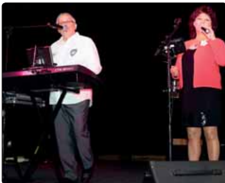
Ve Slovanském domě vystoupilo Duo Adamis známé z pořadu Šlágr TV.