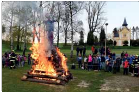
O zapálení centrální městské vaty se postarali jako vždy členové místního sboru dobrovolných hasičů.