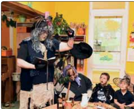
Děti se naučily spoustu zaříkadel, kouzel a ochutnaly také kouzelné lektvary.