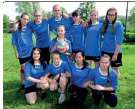
V rámci Šluknovské ligy základních škol se naše děvčata zúčastnila v Jiřkově turnaje ve vybíjeně a po smolných zápasech obsadila čtvrtou příčku.