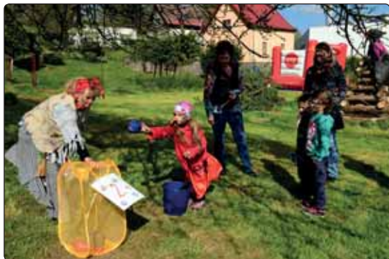
Na zahradě u Huberta bylo opravdu živo, připravené soutěže přilákaly nejen desítky dětí, ale také jejich rodiče.