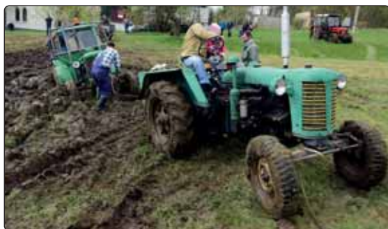
Největší atrakcí na májových oslavách byla opět jízda traktorů bahnem a jejich následně vyprošťování.