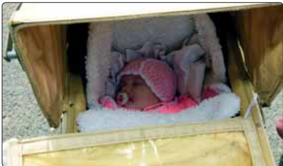
Také nejmladší účastnice ze sousedního Vilémova dorazila v dobovém vozidle.