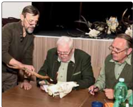
Výstavě mysliveckých trofejí, která proběhla ve Slovanském domě předcházelo pečlivé třídění a hodnocení odbornou komisí.