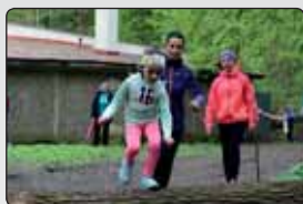
Mikulášovický biatlon rozjel letní závodní sezonu str.8

Slavnosti města 18.6.2017 od 13.30 h. amfiteátr u Slovanského domu