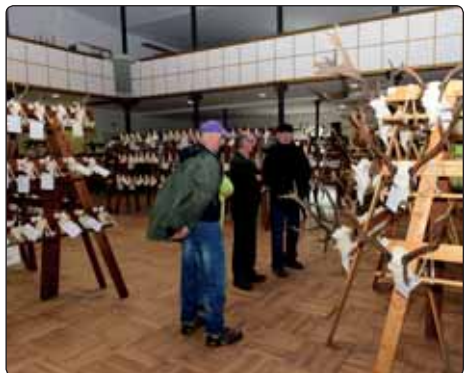
Samotná výstava trofejí byla mimořádně otevřena také v rámci prvomájových oslav.