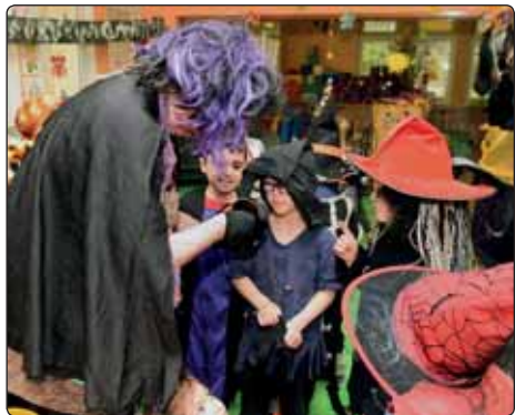
V mateřské škole se tradiční rej čarodějnic a čarodějů opět povedl.