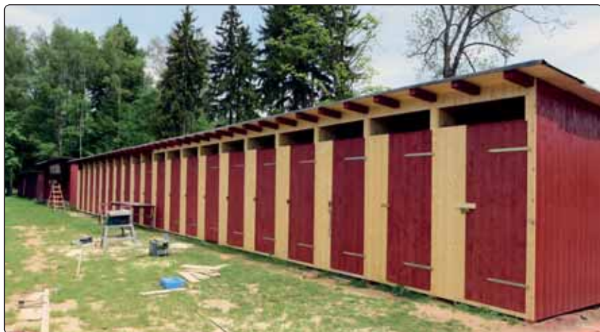
Na koupališti se stále buduje, nové kabiny už finišují a další úpravy se právě rozjíždějí.

Mikulášovický oddíl se na prvním závodě Českého poháru prezentoval nejen skvělými výsledky, ale také zbrusu novou kolekcí týmového oblečení.