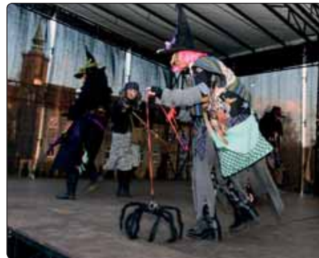
Na pódiu u Slovanského domu se to čarodějnicemi jen hemžilo.