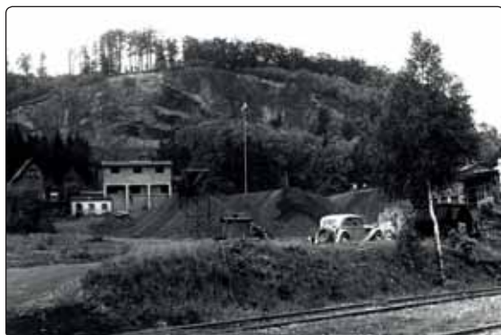
Dominantní vrch Partyzán v dnes vypadá úplně jinak, na snímku vidíte počátky těžby kamene.