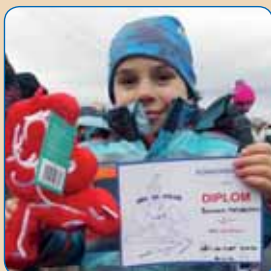
Běh na Chlum str. 6

TURNAJ VE STOLNÍM TENISE 27.12.2017 od 9.00 h. sportovní hala