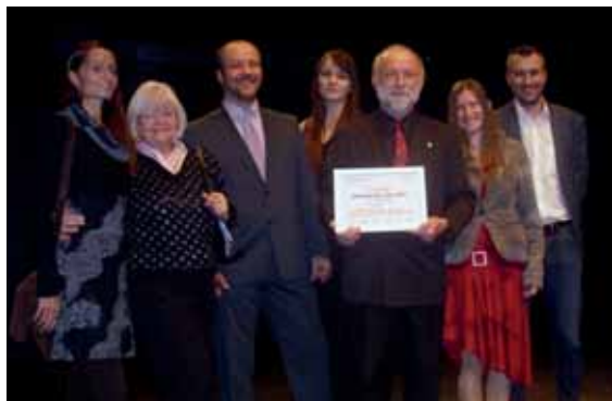
Prestižní cenu „Neziskovka roku“ 2. místo získala základní organizace ČSCH Mikulášovice.

Ocenění Neziskovka roku 2017 podporují: hlavní partner Skupina ČEZ a partneři Česká spořitelna, Plzeňský Prazdroj, Nadace Preciosa, Nadace Neziskovky.cz a Divadlo Archa. Mediálními partnery ocenění je Česká televize, Český rozhlas Radiožurnál a Právo. Za použití podkladů NROS zpracoval Vlastimil Jura st.