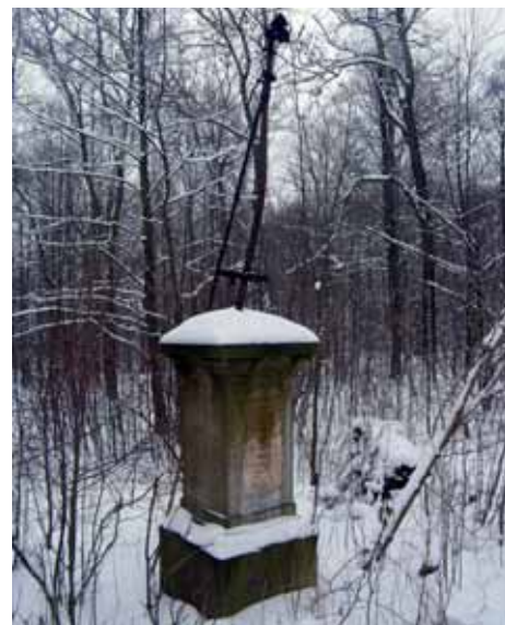
Dochované zbytky Herltova kříže.

Klub biatlonu Mikulášovice pořádá Regionální závod ČP v biatlonu žactva místo konání: areál bývalého kluziště kdy: neděle 14. ledna 2018 od 13.00 hodin