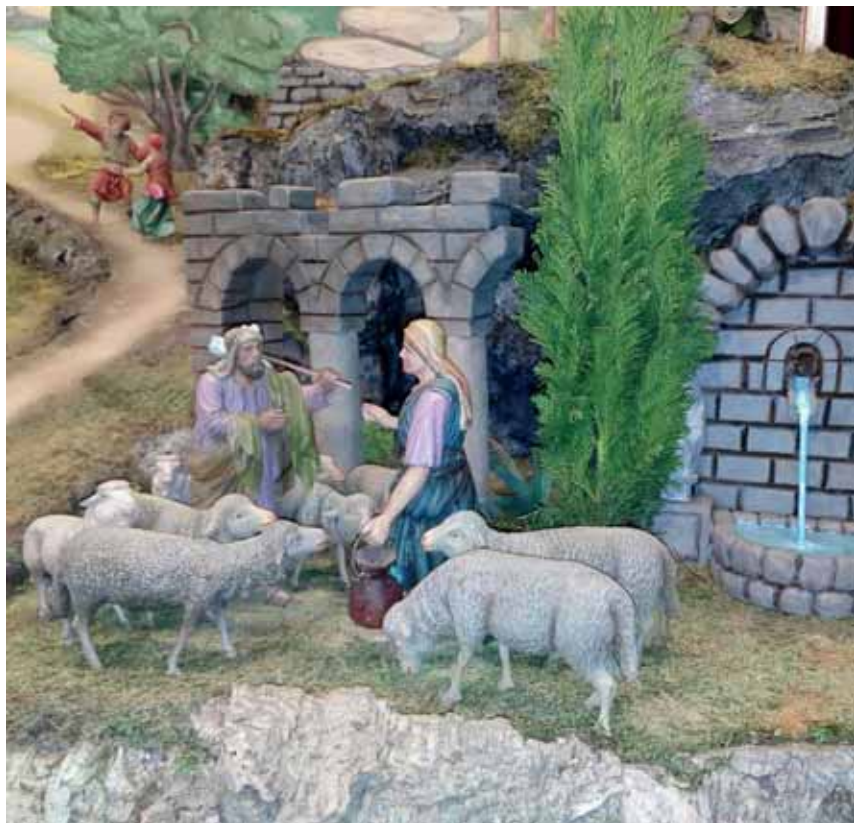
Detail mikulášovického betlému, který bude opět po letech vystaven v místním kostele sv. Mikuláše.