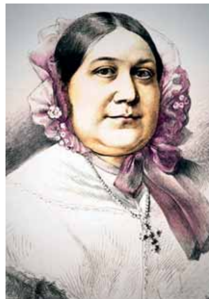
První dáma naší kuchyně včetně té vánoční, Magdalena Dobromila Rettigová (nar. 31.1.1785 – zem. 5.8.1845)