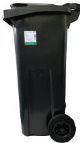
Místo pro nalepení známky