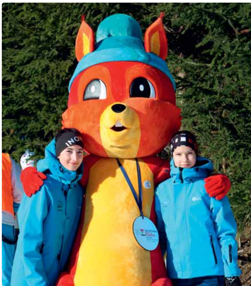
Holký s olympijským maskotem.