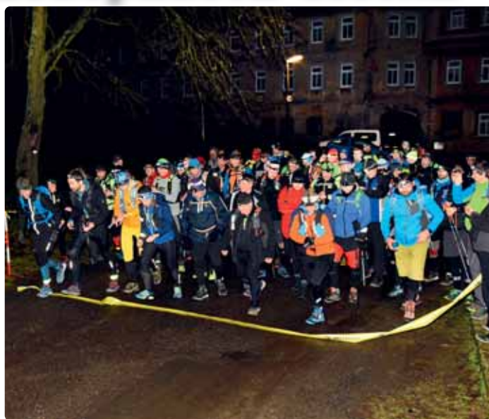
Startovalo se u Slovanského domu hodinu před půlnocí a ti nejlepší již před obědem na druhý den byli v cíli.