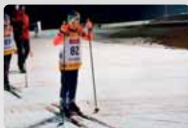
Biatlon na ODM str. 7

Maškarní ples sportovců 21.3.2020 od 20.00 hodin Slovanský dům