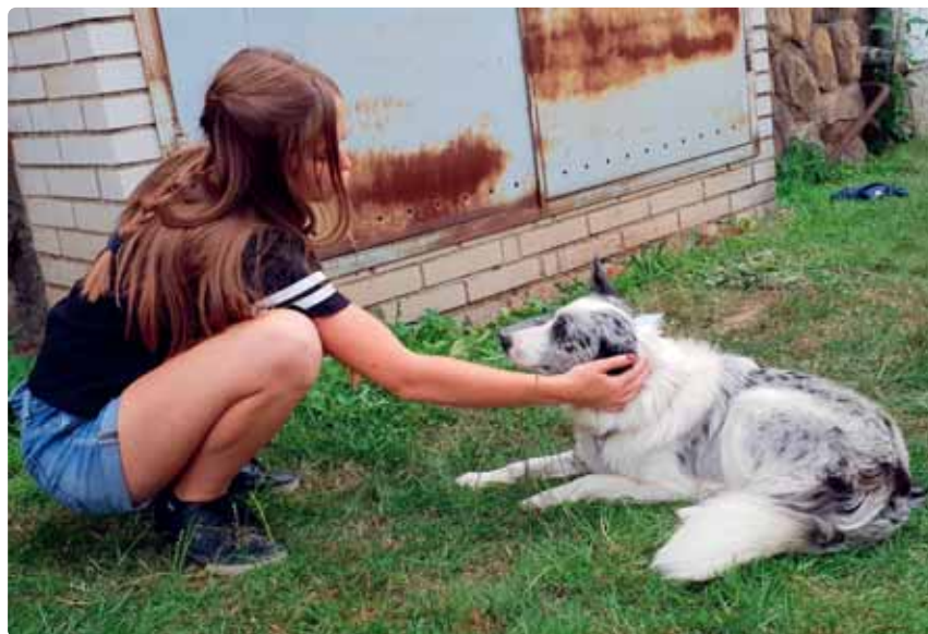
Mladí chovatelé a jejich různorodá činnost.