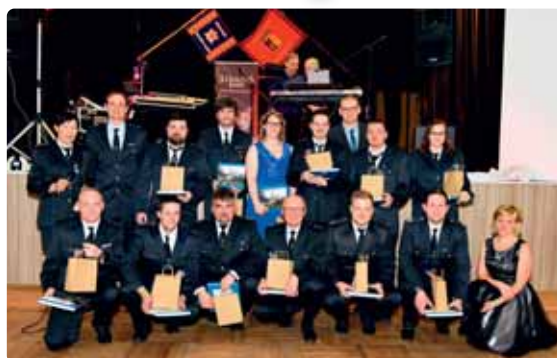
Výjezdová jednotka dobrovolných hasičů Mikulášovic.