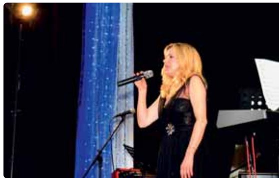
Hlavním hostem večera byla muzikálová star Leona Machálková.