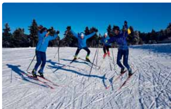
V průběhu olympiády byl čas i na trochu toho dovádění.