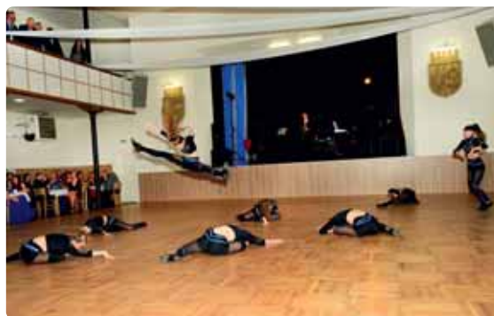
O předtančení se postarala děvčata TŠ Step by Step.