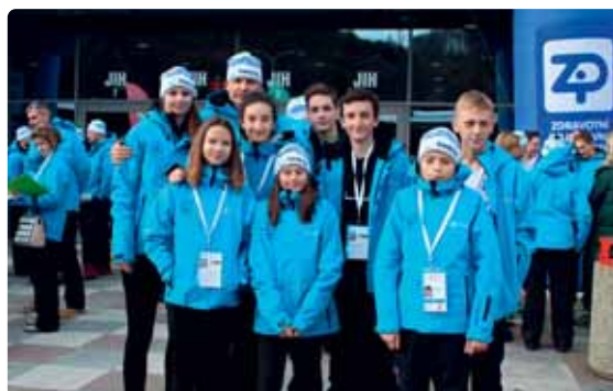
Výprava Ústeckého kraje na Olympiádě dětí a mládeže.