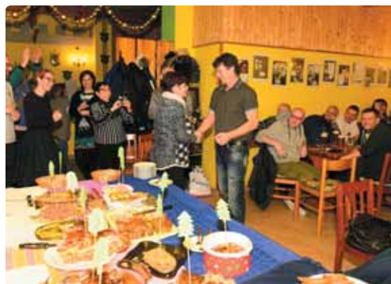
Vánoční čas si užili také štamgasti v restauraci U Vladařů, k této době už neodmyslitelně patří velká kuchařská soutěž. V posledních letech je více či méně boj mezi kulináři z Mikulášovic a zbytkem regionu.