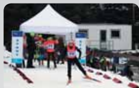
Biatlonisté na prvních závodech str. 8

Ples dobrovolných hasičů 16.2.2019 od 20.00 hodin Slovanský dům