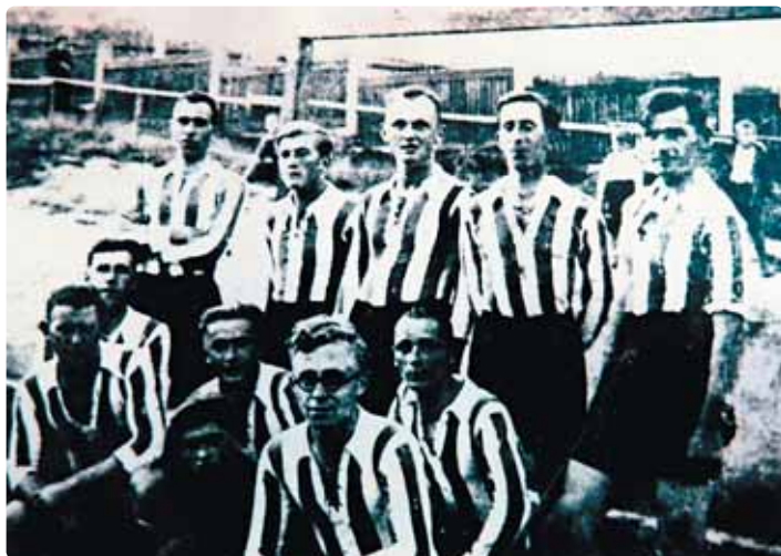
Unikátní snímek prvního poustevenského českého fotbalového mužstva. Bohužel už bez identifikace jednotlivých hráčů, jejichž jména dávno odvál čas. Takto nastupovali v sezóně 1934-35.