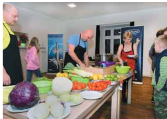
Z nakrájené zeleniny se připravovaly nejrůznější saláty, které přítomné občanstvo v průběhu večera ochutnávalo.