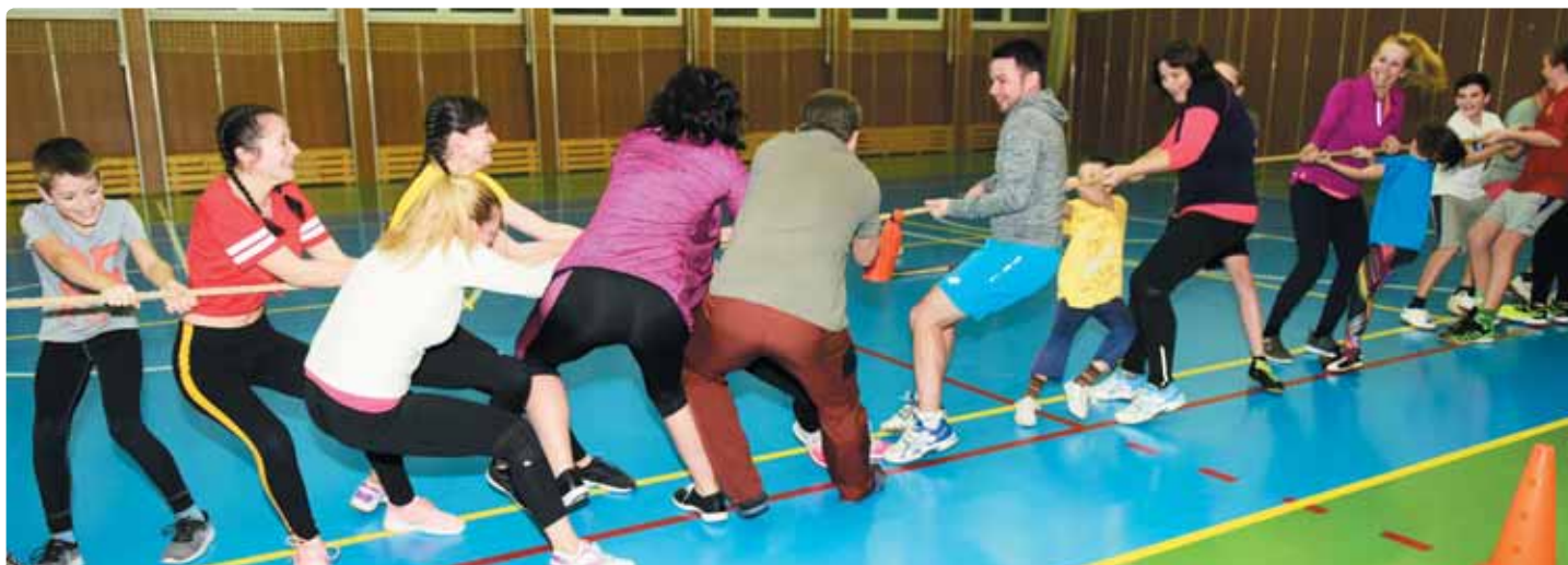
Přetahování lanem se jako disciplína pěstuje již od středověku a není vždy důležité, jak je tým silově disponován, je to mnohdy o taktice.