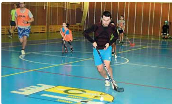
Florbal si nakonec zahráli všichni malí, velcí, kluci i holky.