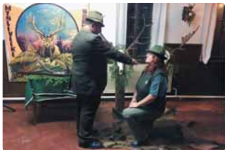
Tradiční akce místního mysliveckého spolku Tesák v úvodu roku bývá „Poslední leč“. Společenské setkání myslivců a jejich hostů je vždy plné legrace, dobrého jídla, tance a také slavnostního pasování nových lovců.