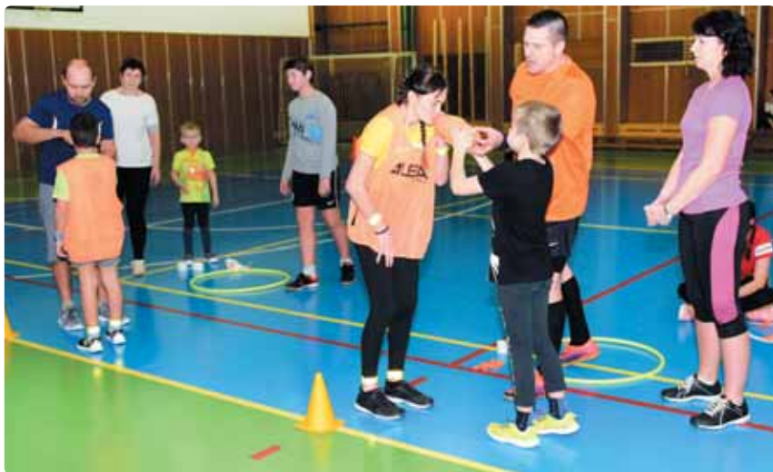
Oběhnout pět koleček kolem tělocvičny a pak nafouknout balónek není vůbec žádná legrace.