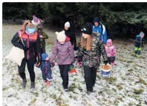
Turistický oddíl mládeže pravidelně se svými nejmladšími členy na štědrý den vyráží do lesa, aby zvířátkům také zpříjemnil čas vánoční. Starý chléb, jablka, mrkev vše co se doma najde, si děti přinesou, letos jsme navíc do lesa nanosili již několik desítek kilogramů žaludů. Nejen o sportovní přípravu, ale i o morální výchovu mladé generace se vedoucí starají také ve spolupráci se Schrödingerovým institutem.