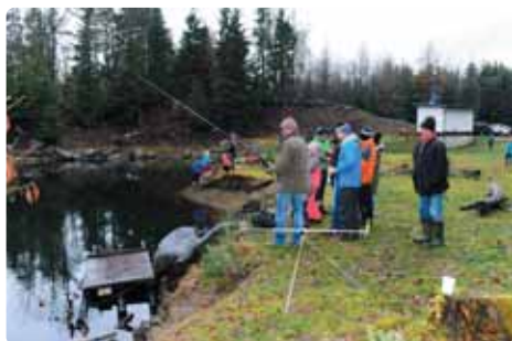
Během vánočních dnů volna se v mikulášovickém lomu konala akce „chyt si svého kapra“, ač je to k nevíře letos opět vyhrály ryby nad natěšenými rybáři.