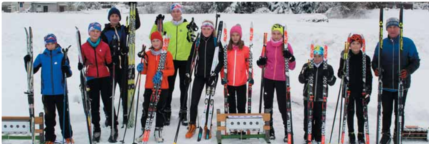
Společný trénink s biatlonem Děčín na kluzišti.