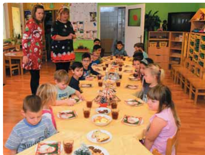
Při vánoční besídce se nerozbalují jenom dárky, děti si také připomínají společenské tradice a tak i v naší školce nesmí chybět přípítek.