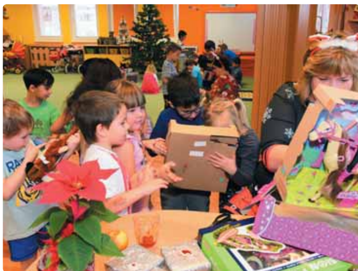
Vánoční nadílka v místní mateřské škole byla opět štědrá, děti se na ní těšily již dlouho dopředu a dárky si nakonec jako každý rok moc užily.