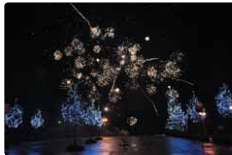
V úterý na Nový rok se uskutečnil na mikulášovickém náměstí ohňostroj. Škoda jen, že pestrou hru barev vánoční výzdoby náměstí a ohňostroje trochu nepodpořilo také přívětivější počasí, i přesto to byla zajímavá podívaná.