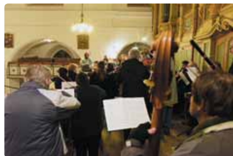
V kostele sv. Mikuláše se mezi Vánoci a Novým rokem opět rozezněly tóny Mše vánoční od Jakuba Jana Ryby.