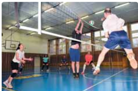
Druhý svátek vánoční si dávají v mikulášovické sportovní hale dostaveníčko volejbalisté. Také letos se jich sešlo několik desítek a turnaj trval až do pozdních večerních hodin.