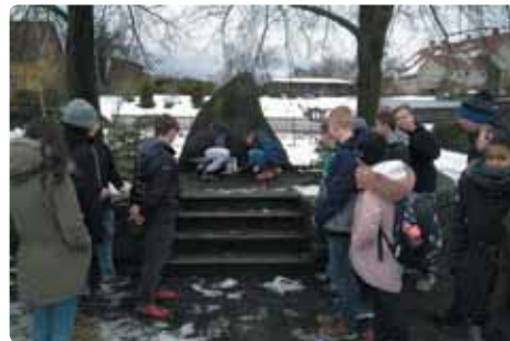
Žáci základní školy si ve středu 16. ledna připomněli památku Jana Palacha.