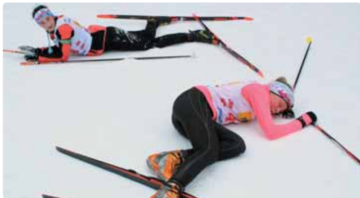
Mikulášovické závodnice na pokraji totálního vyčerpání v cíli závodu.