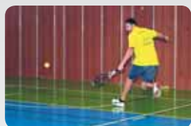
Fotoprávy str. 6-7