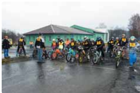
Tradiční výjezd na Tanečnici opět po roce uspořádal Mopedostorpedos, na startu se sešlo několik desítek závodníků a to i přes nepřízeň počasí. Nejprve startovala hlavní kategorie mopedů a ve druhé vlně se pak na trať vydaly upravené speciály.