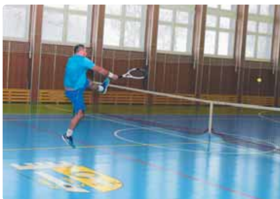
Na první vánoční se v místní sportovní hale již pravidelně několik let pořádá mini turnaj místních tenistů, stejně tomu bylo i letos.