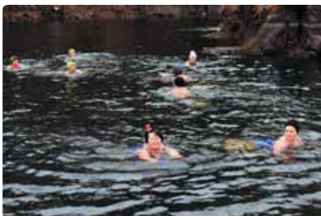
Po beznadějně snaze ulovit nějakou tu rybu přišlo na řadu tradiční otužování, ve vodě se nakonec smočilo mnohem více žen než mužů.