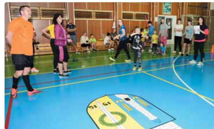
Střelba z luku byla pro některé týmy opravdovým oříškem.