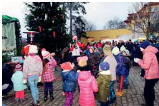
Děti se dočkaly také sněhu, co na tom, že byl umělý, radost byla opravdová.