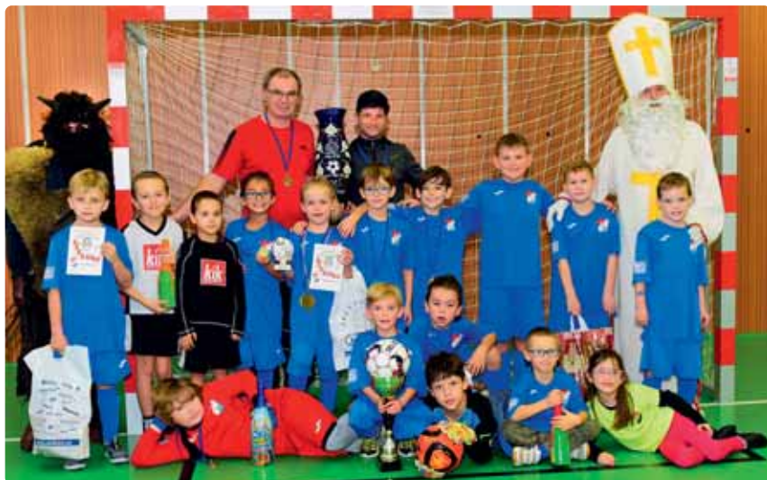
Pohled na mikulášovické fotbalové naděje.

Hned od prvního zápasu dávali kluci z mikulášovického týmu najevo, že turnaj bude probíhat pod jejich taktovkou.