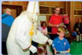
Mikulášský turnaj v kopané str. 7

Novoroční ohňostroj náměstí Mikulášovice 1.1.2020 od 19.00 hod.