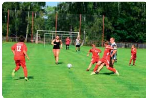
Na hřišti při zápasech s rodiči to jenom vřelo