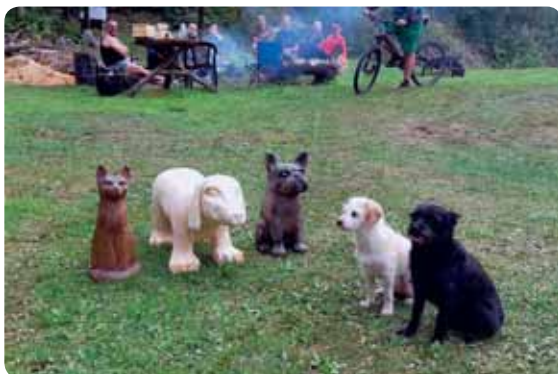
Ti dřevění jako by jim z oka vypadli