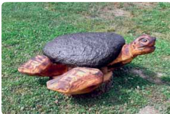
Jedna z mnoha soch, co zkrášlují okolí zatopeného lomu