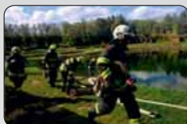
Fotožprávy str. 7