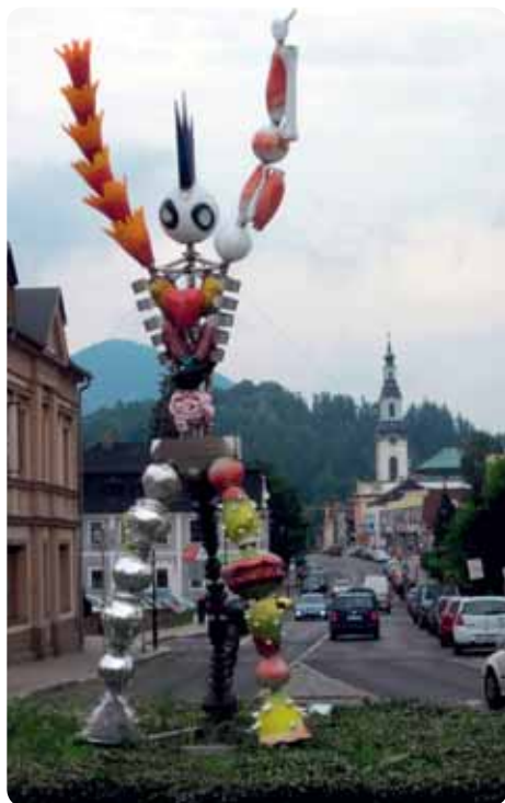
Skleněný ochránce města