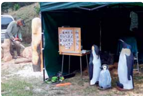
Návštěvníci se mohli nejenom kochat výrobou, dokonce si mohli některé z výrobků zakoupit