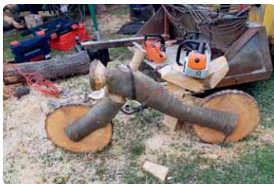
Na letošní řezbě bylo rozhodně na co koukat