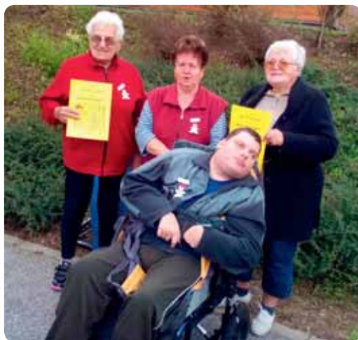
Mikulášovický tým si nakonec odvezl krásné druhé místo