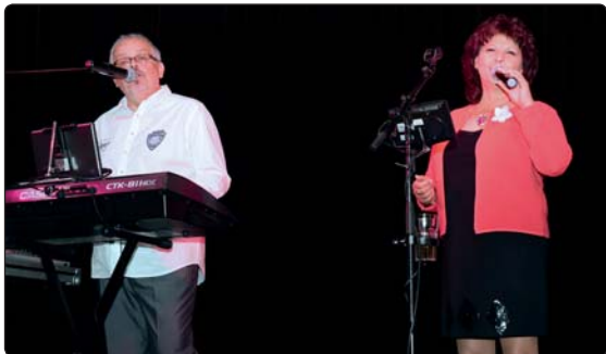
Další akcí ve Slovanském domě bylo vystoupení dvojice Duo Adamis známé z televizního kanálu Šlágr TV. Zahráli k poslechu i tanci pro střední a starší generaci našich spoluobčanů.