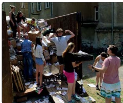
Žáci místní základní školy nasbírali mnoho tun starého papíru a v závěru školního roku si ho také vlastnoručně naložili do velkoobjemového kontejneru.