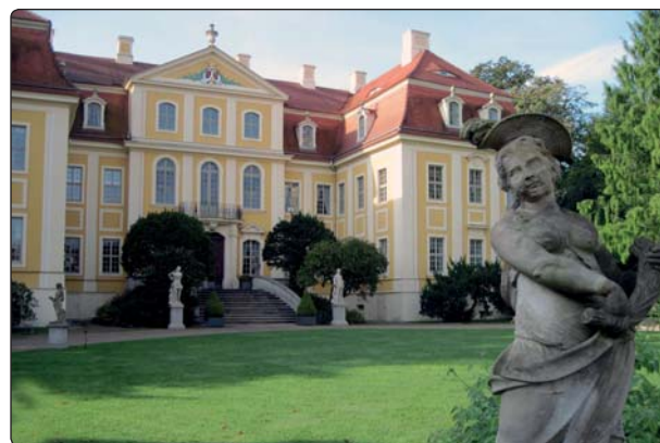
Romantický zámek Rammenau