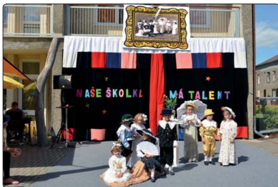
Naše školka má talent, nic jiného není potřeba dodat, každoroční zahradní slavnost to jenom potvrzuje.