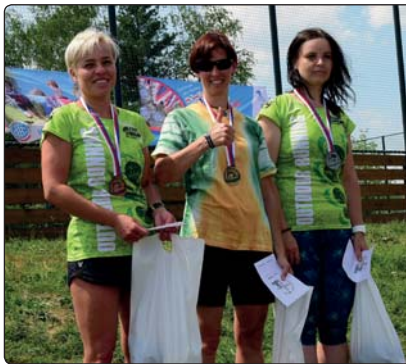
Medailové zastoupení v kategorii žen B bylo dokonce dvojnásobné, navíc již tímto závodem si obě mikulášovické závodnice zajistily právo startu na mezinárodních závodech.