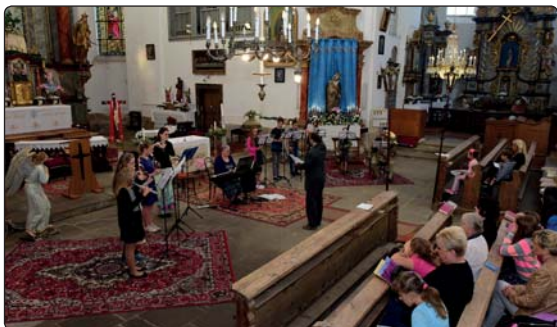
Žáci základní umělecké školy pravidelně vystupují v místním kostele u příležitosti nejrůznějších akcí.