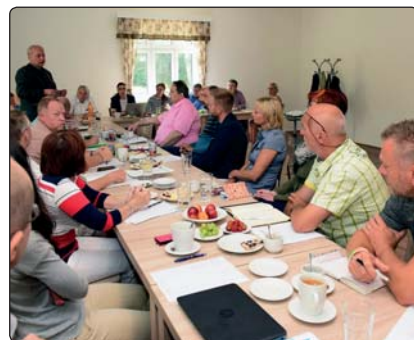
Pravidelné setkání starostů a dalších hostů proběhlo v nově zrekonstruovaných prostorách restaurace ve Slovanském domě.