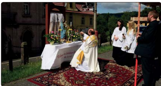
Slavnost Těla a Krve Páně, společnou mši svatou s průvodem pořádali místní farníci od kostela ke kapli Fürleho u DPS.