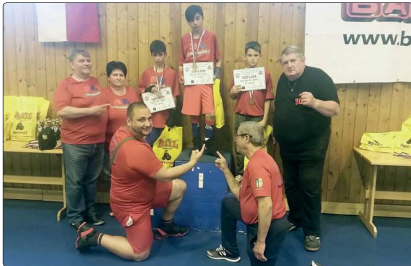
Úspěšná výprava mikulášovických boxerů