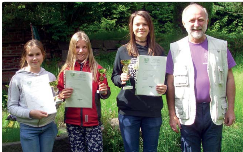
Členové místního spolku chovatelů úspěšně reprezentovali město na okresní soutěži.

Gratulujeme vítězům a přejeme jim hodně úspěchů v Poběžovicích. Současně vyzýváme další mladé chovatele z Mikulášovic, kteří chtějí poměřit své znalosti o zvířatech, aby se přihlásili do příštího ročníku olympiády. Budou mít zážitky na celý život! Vlastimil Jura st.