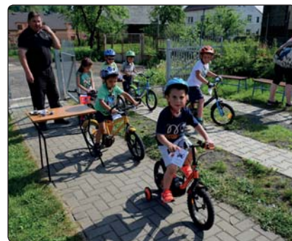
Dopravní akci si užily děti v naší mateřské škole, kterou připravila městská policie Rumburk.