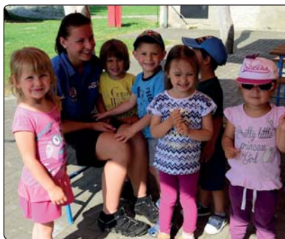
Během dopravního dopoledne si mateřinky povídaly nejen o dopravě, ale i jiných činnostech, které jsou v kompetenci městské policie.