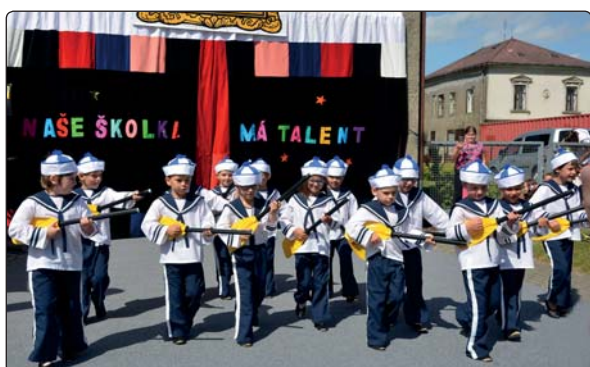
Zahradní slavnost opět přilákala mnoho diváků nejen z Mikulášovic, ale i širokého okolí.