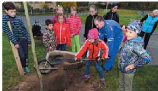
Tímto aktem si děti připomněly významnou událost, která před sto lety znamenala pro náš národ nezapomenutelný okamžik.