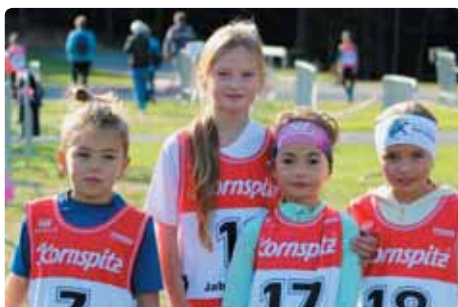
Mikulášovická biatlonová příprava při závodě v Jablonci nad Nisou.