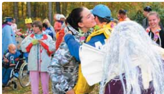
Neskrývaná radost byla vidět na každém kroku.