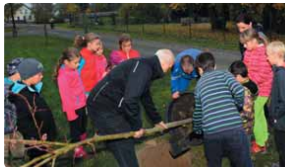
Turistický oddíl mládeže vysadil několik pamětních stromů ke stému výročí vzniku Československa.