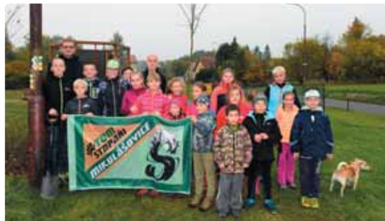
Akte se zúčastnili zejména nejmladší členové oddílu a sázení pamětních lip je opravdu bavilo, tento projekt byl podpořen díky přispění Ústeckého kraje.