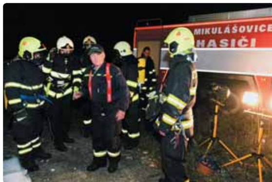
Hlavním úkolem cvičení byla práce s dýchacími přístroji a dohledávání zraněné osoby v nepřehledném prostoru. K nácvičku posloužila budova bývalého vojenského radaru, akce proběhla za tmy a zadymění celého prostoru.