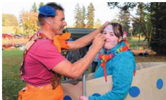
Příprava na závěrečný karneval se nedá podcenit.