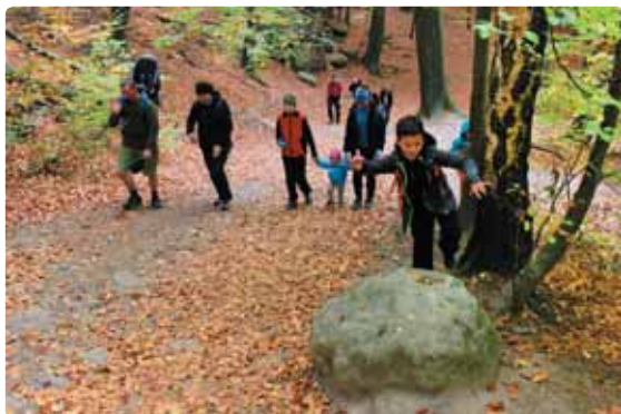
V rámci projektu Ústeckého kraje proběhla také výprava do přírody, tentokrát do Národního parku Saské Švýcarsko, cílem podzimního výletu byl Kuhstall.