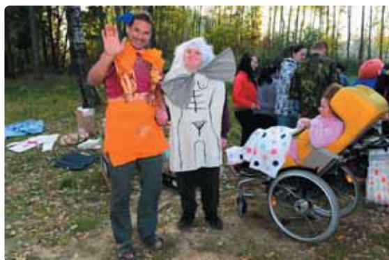
Masky, živá i reprodukováná hudba a hlavně dobrá nálada panovala na mikulášovickém koupališti.