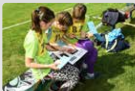
Medailová umístění v Českém poháru str. 8