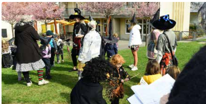
Děti v čarodějnických převlecích si překrásné slunečné dopoledne opravdu užívaly