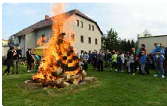
O zapálení vatra se nakonec postarali místní hasiči.