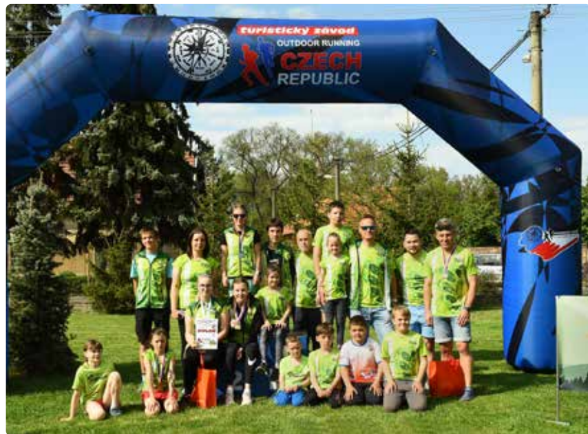
Mikulášovičtí běžci zvládli vstup do sezony závodů Českého poháru v Hostíně u Vojkovic