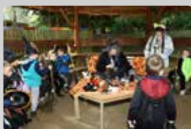
Předškoláci si čarodějnický rej užily na školní zahradě str. 2