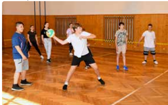
Žáci naší základní školy se zúčastnili turnaje ve vybíjené smíšených družstev ve Velkém Šenově, mezi deseti startujícími družstvy se rozhodně neztrařili. Družstvo mladších si vybojovalo krásné 2. místo a starší pak získali pomyslný bronz.