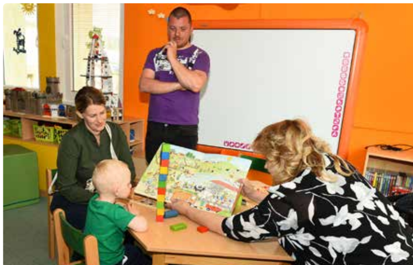
V mikulášovické mateřské škole proběhl na začátku května zápis dětí, které by se měly zařadit od následujícího školního roku do pravidelné předškolní výchovy