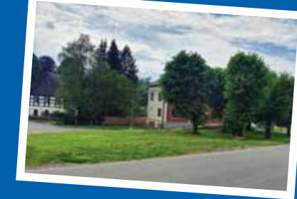
1. zbořiště Na schodech 2. stará pekárna 3. č.p.1 Střelnice