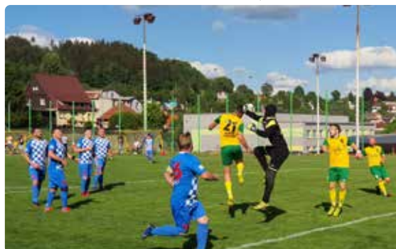
Mikulášovičtí fotbalové „áčko“ sehrálo derby utkání v Dolní Poustevně. Přesto, že hráči domácí Poustevny tlačili a měli řadu šancí, nakonec byli šťastnější naši hráči, kteří zvítězili 2:1 a připsali si do tabulky cenné tři body.