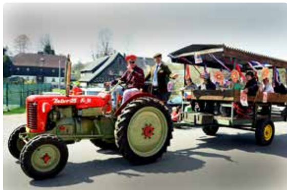
Očekávané přeháňky Mikulášovice minuly, a tak si prvomájovou jízdu všichni užili

SBĚRNÝ DVŮR každý všední den od 14.00 do 16.00 hodin sobota 4.6. a 18.6. od 9.00 do 11.00 hodin