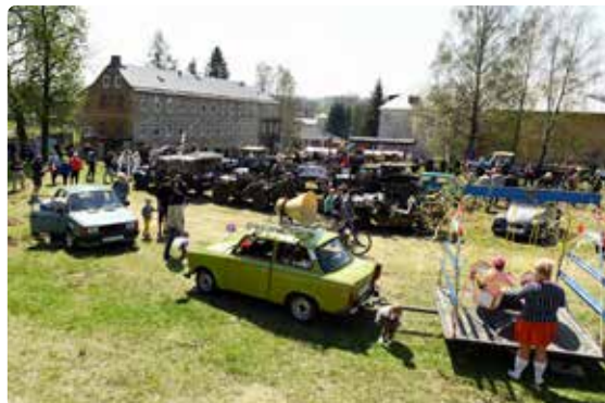
Tradiční odstavné parkoviště májových strojů již dlouhé týdny devastují divoká prasata, všechny dopravní prostředky však nerovný terén zvládly na jedničku