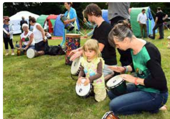
Společné bubnování navodilo velmi pozitivní atmosféru