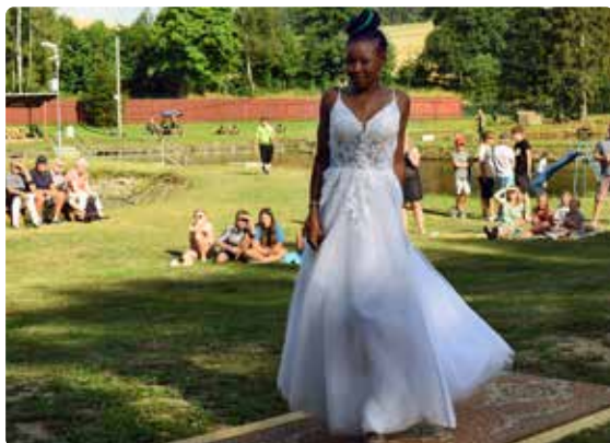
Modelky představily nejen kolekci letního oblečení a spodního prádla, ale také luxusní svatební šaty