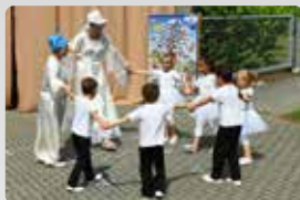
Fotozprávy str. 4-5

Sobota 6.8.2022 NOŽIŘSKÉ SLAVNOSTI městské koupaliště fotbalový areál celodenní bohatý program