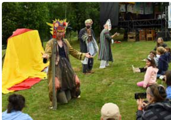
„Neboječek v nebi“ divadelní pohádka, která zaujala nejen děti