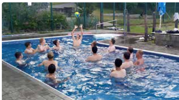
Kluci si v Doksech užili hodně pohybu, ale také legrace

Trenéři žakovských mužstev FK Mikulášovice