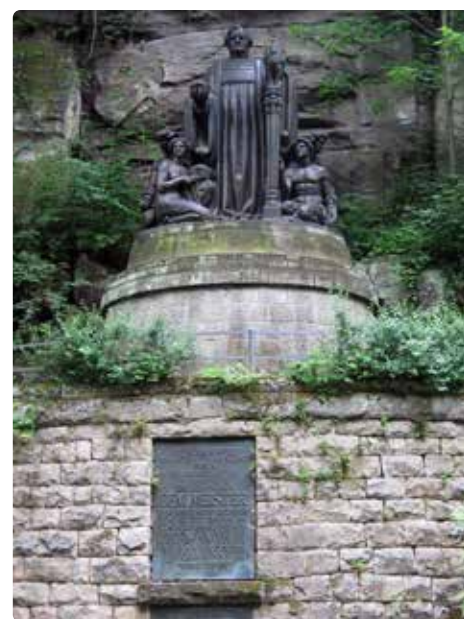
Socha Richarda Wagnera u říčky Wesenitz