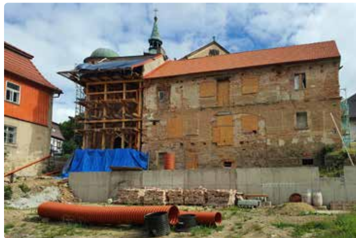
Současný stav na stavbě kulturní památky hvězdárny po zastavení prací