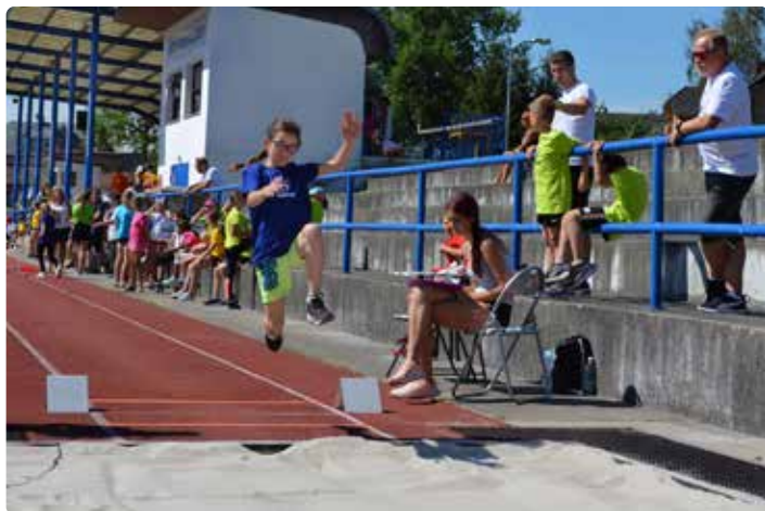
Disciplína skoku do dálky je pro mnohé hendikepem, vždyť na mnoha menších obcích chybí i provizorní doskočiště.