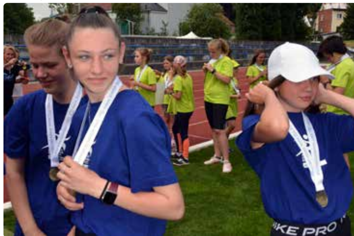
Radost z příjemně stráveného dne i krásných pamětních medailí.