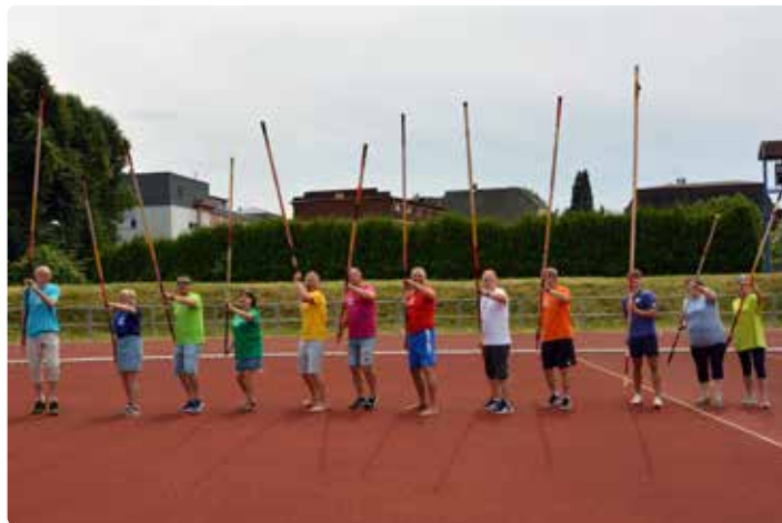
Starostové měst a obcí si pod odborným vedením zkouší jak se drží „výškařská tyčka“.