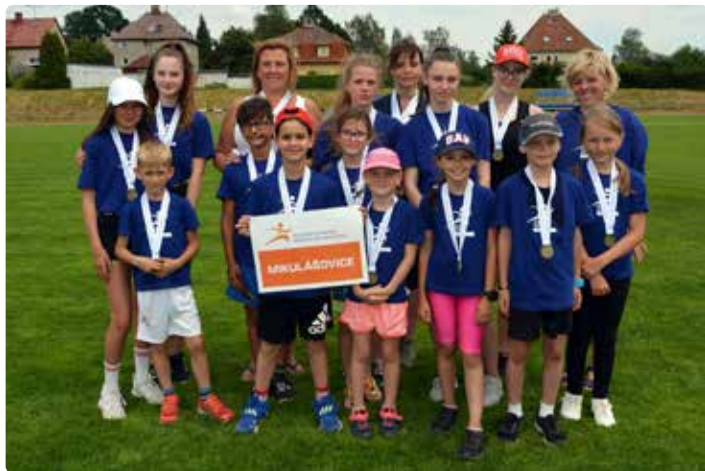
Mikulášovické družstvo, na fotce nekompletní, někteří se neprodleně po sportovním výkonu již vraceli do místa pobytu fotbalového soustředění.