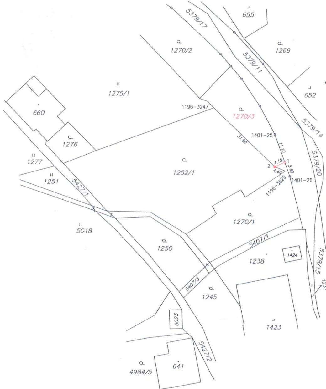
Seznam souřadnic (S-JTSK)

mobil: 739 452 733 V Mikulášovicích dne: 10. srpna 2023