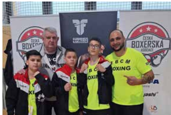
Úspěšná výprava mikulášovických boxerů v Bruntále