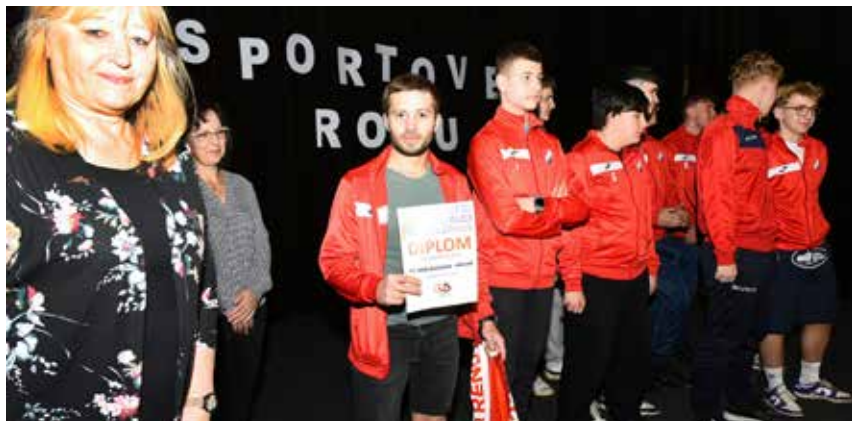
Jedním z oceněných celků byl mikulášovický fotbalový dorost