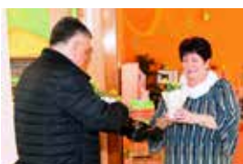
Fotoprávy str. 2