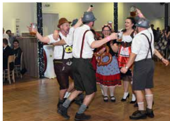
Promenáda masek před vyhodnocením pořadí