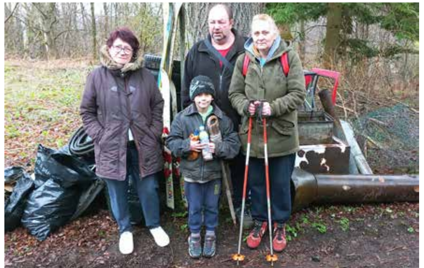
Letos prvním rokem chovatelé uklízeli v okolí svého nového působiště nedaleko nádraží v dolních Mikulášovicích