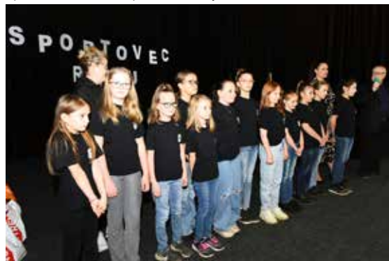
Ocenění převzala také TŠ Step by Step