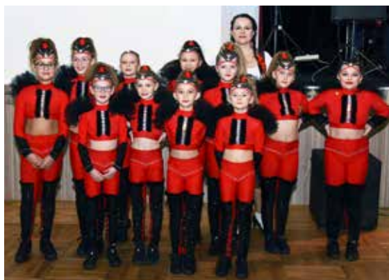
Nejmladší děvčata s taneční školy Step by Step