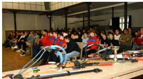
Sportovní oddíly se prezentovaly nejen prostřednictvím svých sportovců, ale také prezentací vybavení a cen ze soutěží