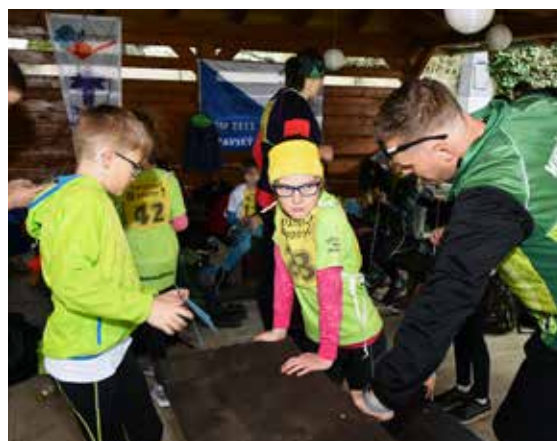
Poslední taktické informace před startem prvního závodu sezony přicházejí nejmladším závodníkům od těch starších zkušenějších