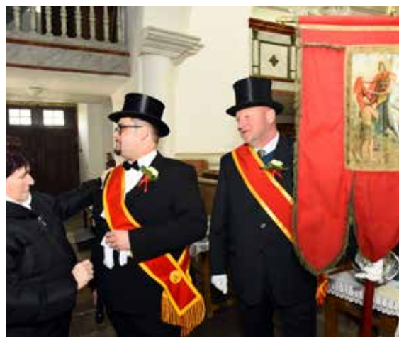
Poslední úpravy samotných účastníků jízdy