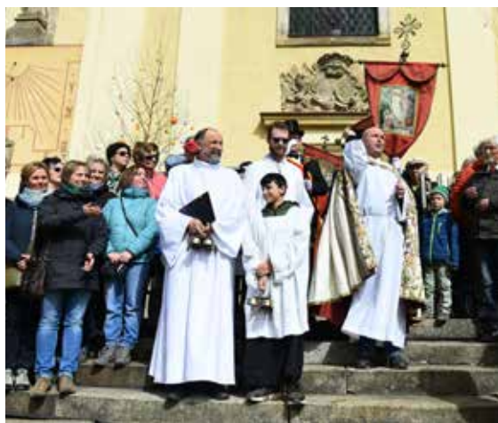
Před samotným zahájením jízdy ještě požehnutí